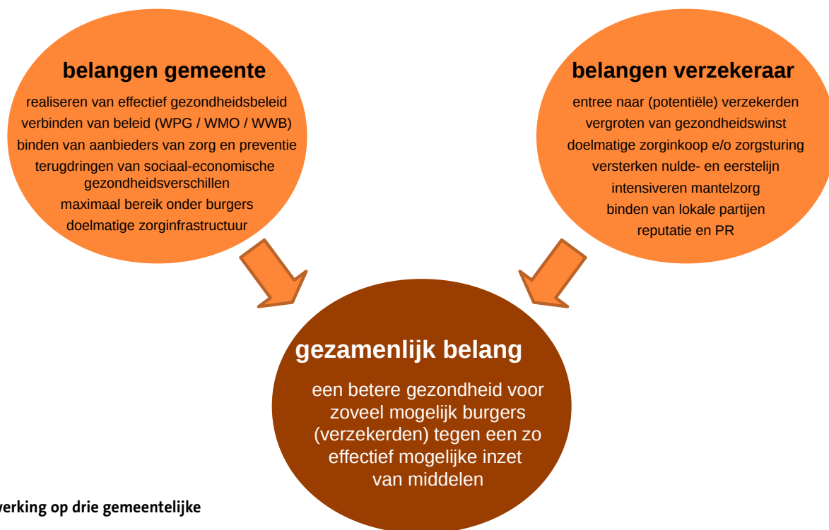
Figuur 2: Samenwerking op drie gemeentelijke beleidsterreinen.

zorg. Het gaat dan niet alleen om een verzekerd pakket, maar steeds vaker ook om samenwerking op het gebied van schuldhulpverlening, re-integratie en preventie (RVZ 2010). Deze collectiviteit activeert de verzekeraar om te investeren (financieel én organisatorisch) in het gemeentelijke gezondheidsbeleid, en hij krijgt zo zijn gewenste 'premie en polis'. De CZM, de polis, is eigenlijk de fysieke verschijningsvorm van de samenwerking tussen gemeente en zorgverzekeraar.